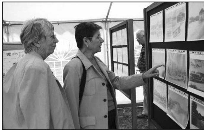
U příležitosti mezinárodní akce pořádané hospodářskými komorami a městy ležícími podél Labe byla na litoměřickém Lodním náměstí krátkodobě instalována výstava k lodní dopravě.