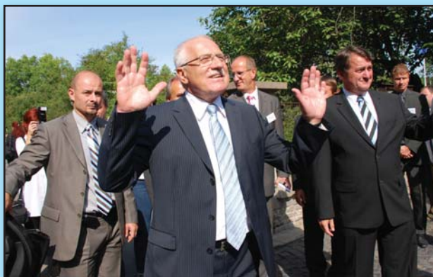
Po dvou hodinách se prezident rozloučil s Litoměřičany. Ještě před tím se stačil vyfotografovat s pedagogickým sborem.