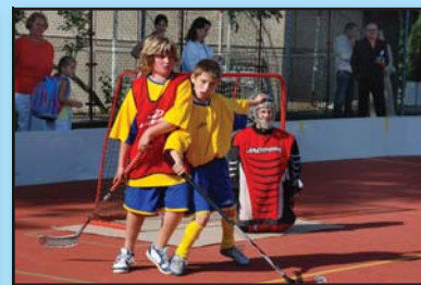
Žáci předvedli, jak dobře umí hrát florbal.