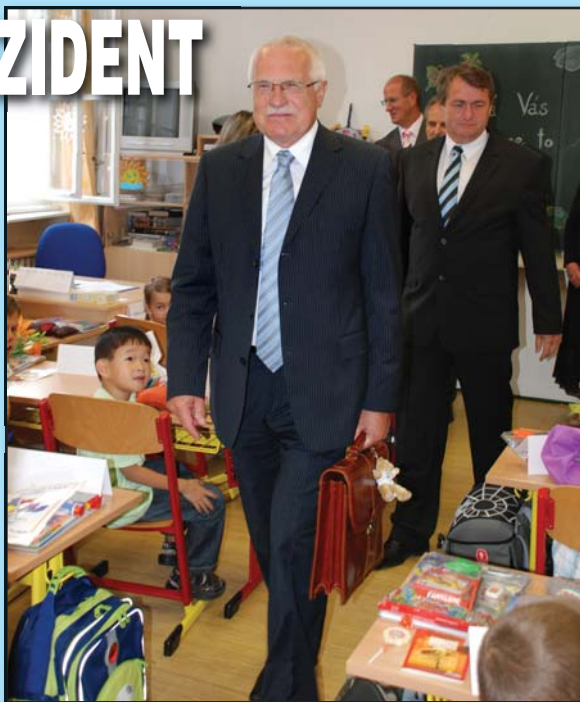
Ze třídy odkráčel s aktovkou v ruce, která byla dárkem od hejtmána (vpravo).