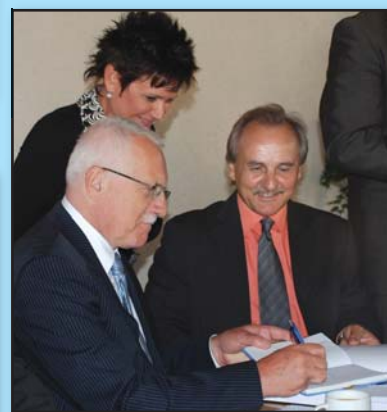
V zahradním altánu se profesor podepsal starostovi do pamětní knihy města.