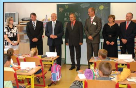
Prezident si za prvňáčky došel až do jejich tříd, kde si s nimi povídal nejen o tom, co je ve škole čeká, ale i o právě skončených prázdninách.