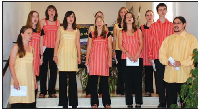
Mezi nejmladší pěvecká tělesa patří v Litoměřicích Syrinx.

První místo v kategorii Instrumentální komorní soubory a zvláštní cenu poroty obdržel soubor Oethos (studentky Střední pedagogické školy J.H.Pestalozziho), který se