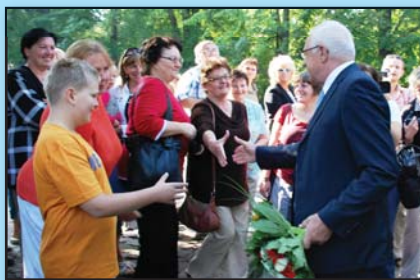
Na prezidenta čekala před školou veřejnost a ve třídách prvňáčci.