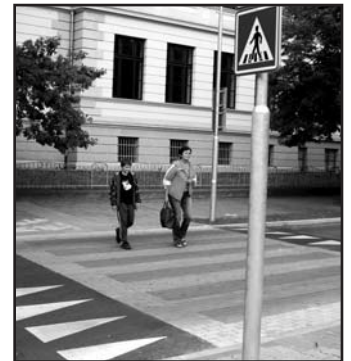
Před Základní školou B. Němcové je nový vyvýšený přečhod pro chodce.

... Vedení odboru dopravy a silničního hospodářství městského úřadu připravilo řadu dalších projektů vedoucích ke zvýšení bezpečí chodců. Nový přečhod by mohl být vybudován i za pokratickými závorami, v místě, kde řidiči odbočují do ulice Revoluční. Otázkou zůstává, zda v rozpočtu města zbudou na realizaci akce finanční prostředky.