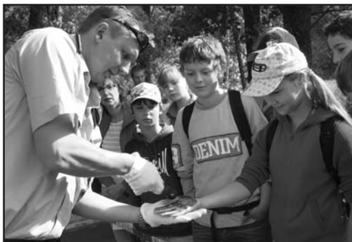
Kromě jiného policisté dětem ukázali i způsob snímání otisků prstů.

Policisté zároveň dětem vysvětlovali, jak se mají chovat, když zjistí, že jim někdo odcizil kolo, a co je čeká při případném sepsování protokolu o krádeži. I přes ne-