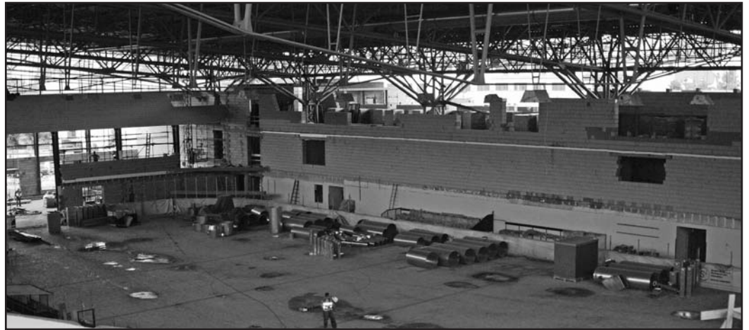
Pohled na rozestavěný stadion.