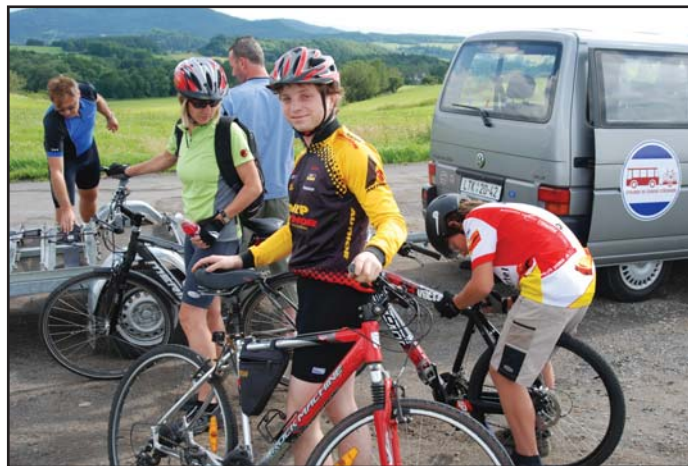
První cyklisté si vyjeli cyklobusem k Mukařovu.

Kopec Varhošť (639 metrů nad mořem) je výraznou dominantou Českého středohoří. Tyč se nedaleko Litoměřic. Výhled z něj je srovnáván s výhledem z Milešovy. Mukařov se nachází v místě, kde okolní kopce a lesy nabízejí větší množství tras jak pro jízdu na kole, tak i pěší turistiku. Turisté oblíbeným místem je i Opárno. Milovníci kol zde hojně využívají cyklostezku vedoucí z Mostu do Doks. Zájemci mohou vystoupit i na zdejší kopec Lovoš a navštívit skalní průrvy Porty Bohemiky.