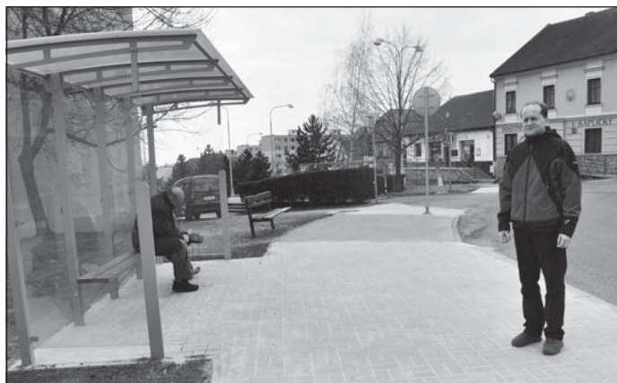
Nová autobusová zastávka U Kapličky.

Novou zastřešenou autobusovou zastávku dostali v uplynulých dnech do užívání obyvatelé Pokratic. Zároveň se stavbou zastávky nacházející se přímo před dětským