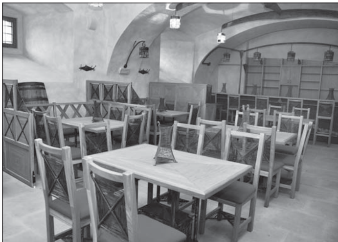
Nová vinárna bude otevřena v polovině dubna.