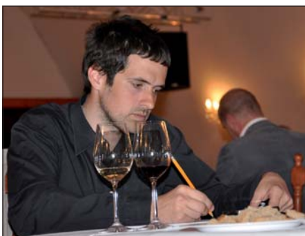
Celkem 522 vzorků vín hodnotilo v sále hotelu Koliba 51 odborníků. Soutěžní vzorky budou zastoupeny i v domě kultury.