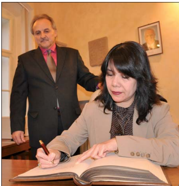
Návštěvu indonéské velvyslankyně bude připomínat i její zápis do pamětní knihy města.

Emeria Siregar se následně zúčastnila vernisáže dvou výstav „Slepiččin poslední červánek“ a „In Between“, které byly zahájeny v litoměřické knihovně. Výstava „Slepiččin poslední červánek“ představuje obrazy české umělkyně Heleny Hoškové, které vznikly indonéskou tradiční technikou batik. Na výstavě „In Between“ se svými kresbami a tisky představili dva vizuální umělci z Indonésie.