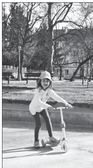
Fontánu si lidé přejí zachovat. V těchto dnech bazén ještě není napuštěn, a tak prostor využívají ke skotačení děti.

V anketě se vyjádřilo více než devět stovek respondentů. „Tak vysoký zájem svědčí o tom, že lidem na parku záleží,“ komentovala tento fakt Lenka Brožová. Nejvíce respondentů přitom pocházelo z věkové kategorie 21 až 40 let, následovaly odpovědi patnácti až dvacetiletých lidí, což je nepochybně dáno tím, že v těsném sousedství Jiráskových sadů stojí gymnázium. Více než polovina respondentů nenavštěvuje park s dětmi. Pokud