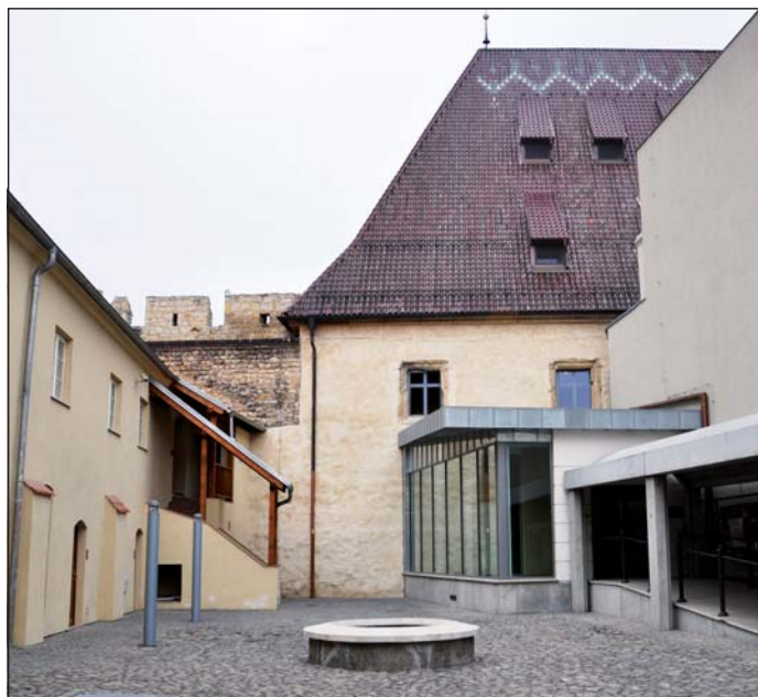
Pohled na gotický hrad z Tyršova náměstí. Vpravo se nachází hlavní vstup, vlevo vidíme správní budovu. Vchod do vinárny je z ulice Na Valech.