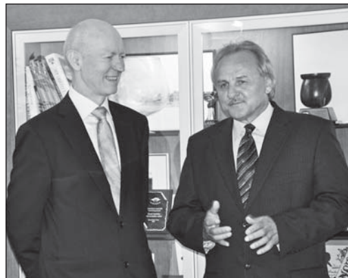
Velvyslance Norského království v České republice Jense Eikaase starosta doprovodil i na biskupství.

V průběhu posledních dvou měsíců navštívili město Litoměřice hned dva velvyslanci. V polovině dubna přijela vůbec poprvé před několika málo týdny do funkce filipínské velvyslankyně v České republice jmenovaná Evelyn D.Austria – Garcia. Jak zdůraznila, hodlá i nadále rozvíjet přátelské vztahy mezi Filipíny a městem Litoměřice.