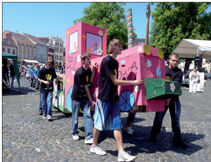
Za růžovou lokomotivou bylo 1061 vagónů.

Součástí kulturního programu na náměstí byly různé soutěže, podpis petice na Nobelovu cenu míru sira Wintona, výroba vagónků pro příchozí a Masarykovou ZŠ uspořádaný běh s mašinkou