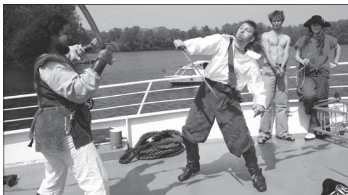
Loď byla přepadena piráty i při slavnostním zahájení sezóny.

„Obzvláště pro děti bude tím nejzajímavějším přepadením lodi piráty z Labibiku, k němuž dojde každou prázdninovou neděli na Píšťanském jezeře. Půjde o originální komponovaný pořad, v průběhu kterého účastníci plavby prožijí hrůzostrašný příběh a setkají se s opravdovými piráty,“ slibuje neuvěřitelnou podívanou s mnoha překvapeními