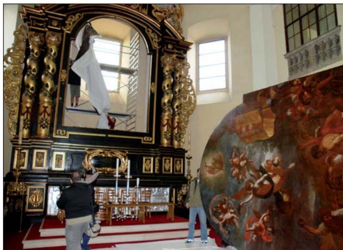
Hlavní oltářní obraz katedrály (výška téměř pět metrů a šířka více než tři metry) se z Jízdárny Pražského hradu vrátil na své místo.

Hlavní oltářní obraz Ukamenování sv. Štěpána a dva Škrétovy obrazy z bočních oltářů byly z katedrály sv. Štěpána odvezeny před dvěma lety. Restaurátoři je totiž připravovali pro výstavu, která u příležitosti 400. výročí malířova narození probíhala v Jízdárně Pražského hradu a ve Valdštejnské jízdárně na Malé Straně od listopadu roku 2009 do dubna 2011. Průzkum litoměřických pláten potvrdil, že obrazy jsou skutečně dílem zakladatele barokního malířství v Čechách. (mich)