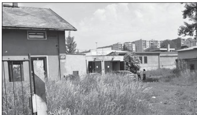
Pohled od pokratických závor. Vzhledem k husté dopravě by ale vjezd do areálu byl z Nerudovy ulice.