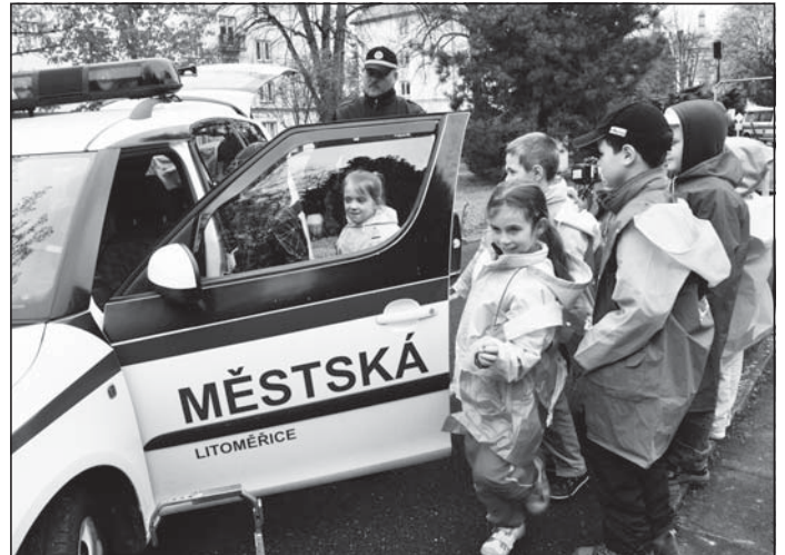
Kromě záchrannářů, policistů a hasičů předvedli dětem na dopravním hřišti v Litoměřicích svou techniku i strážníci městské policie.

Například 26. dubna se v mateřské škole v Eliášově ulici seznámily s činností složek IZS a prevencí úrazů předškolní děti. 25. května se na výstavišti Zahrady Čech dozvěděli žáci devátých tříd základní informace o právním podvědomí mladých lidí, nebezpečnosti drog, o postupu při získání řidičského průkazu a o činnosti Policie ČR.