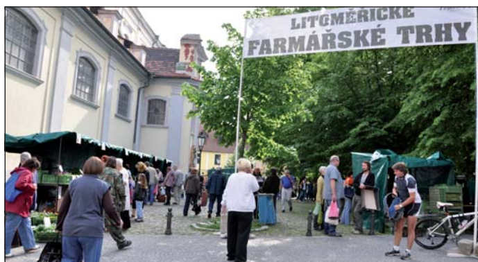
Trhy probíhají na Kostelním náměstí.

Organizátorem je společnost Výstavy, která navázala na tradici zemědělských trhů, jež se v centru města v minulosti konaly. „Pro návštěvníky jsou na pultech více