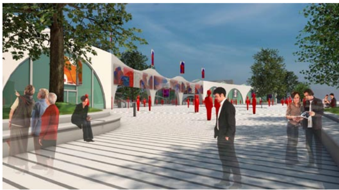
Vizualizace poskytnutá společností EXPO.CZ ukazuje, jak by mohl vypadat budoucí vstup na výstaviště.

4.4. – 8.4. Tržnice Zahrady Čech. Jarní akce pro zahrádkáře, kutily a milovníky přírody nabízí návštěvníkům tradiční zahrádkářský sortiment. 4. – 7. 4. Můj dům, můj hrad. 20. ročník stavební výstavy a výstavy o bydlení, která je zaměřena na stavební materiály a na různé možnosti energetických úspor od zateplování objektů, výměny oken a topných systémů, izolační materiály a větrací systémy. Výstava Bydlení nabízí návštěvníkům nábytek a bytové doplňky. 18. – 20. 5. Tempo, RC model show. Motoristická výstava, jejíž součástí je každodenní kulturní a doprovodný program, který zahrnuje mezinárodní sraz historických vozidel (19. 5.), sraz motorkářů a závody a předváděcí akce RC modelů. 26. – 27. 5. Nord Bohemia Canis. Mezinárodní výstava psů všech plemen. (Pozn.: Letošní akce ještě pořádá společnost VÝSTAVY.)