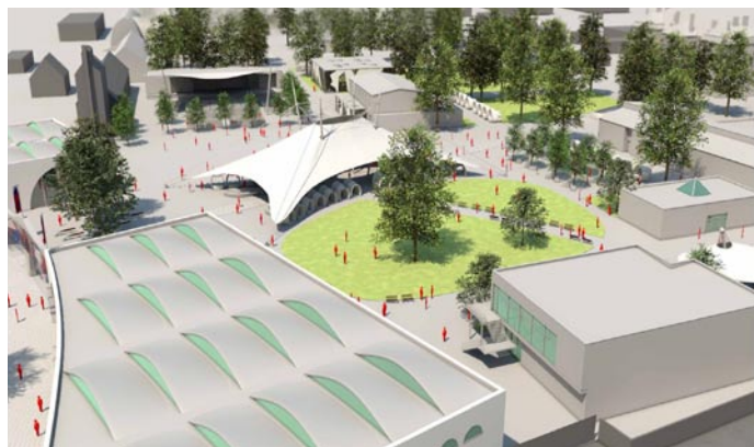
Postupně by mělo dojít i k úpravám vnitřní části areálu.

Společnost EXPO.CZ vloží do nové obchodní společnosti, v níž bude vlastnit padesát procent, deset milionů korun. Dalších 30 až 40 milionů hodlá zajistit prostřednictvím bankovních úvěrů, kterých chce využít na přestavbu pavilonů, v ideálním případě jako spoluúčast k získaným dotacím.