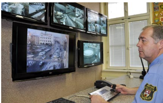
Kamerový systém výrazně zkvalitnil práci městské policie.

Na Mírovém náměstí sídlili strážníci tři roky. Poté se na další tři roky přestěhovali do budovy městského úřadu v Pekařské ulici a následně do Zahradnické ulice, do bývalého objektu záchraně