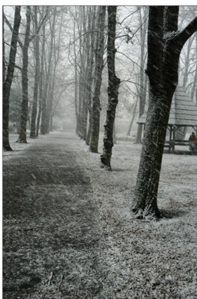
Snímek „Fujavice“ od Eduarda Čecha je vítězem soutěže.

Porotu svou kvalitou nejvíce oslovil snímek Eduarda Čecha s názvem „Fujavice“, na druhém místě se umístila Jarmila Kacarová se snímkem „Němí pozorovatelé“, který ukazuje kůru stromů v parku s vyrytými vzkazy v detailním záběru. Třetí místo obsadila fotografie fontány od Josefa Rottera nazvaná „V podvečer“.