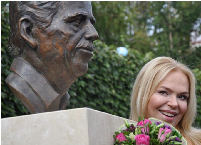
Necelý rok po smrti Václava Havla odhalila v Litoměřicích paní Dagmar bustu svého manžela.