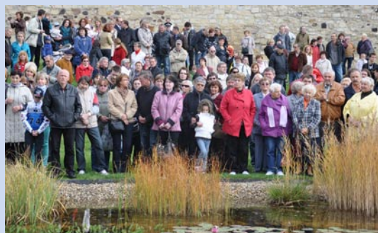
Na slavnostní okamžik se přišlo podívat několik stovek lidí.

„Václav Havel byl noblesní muž a politik. Představoval to nejlepší z toho, co jsme zvyklí nazývat étosem a elegantí první republiky. Dokázal spojovat lidi, kteří by se jinak buďto vůbec nepotkali, nebo by se vzájemně vyhnuli velkým obloukem. Mám intenzivní dojem, že právě to-