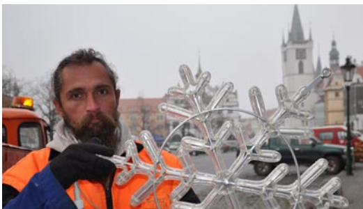
Nové ozdoby osazovali pracovníci Technických služeb.