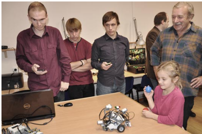
Malí i velcí účastníci slavnostního otevření klubu si prohlíželi i robotické sady.