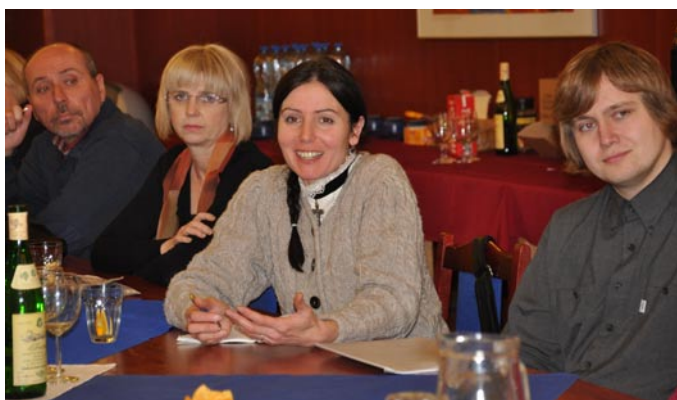
Zástupci pěveckých sborů, divadelních souborů, neziskových organizací a dalších subjektů debatovali s místostarostou Krejzou o možnostech spolupráce.

„Způsob rozdělování grantů kulturní komisí se zdá být spravedlivý. Co však sami nezvládáme, protože nemáme finance na tisk propagačních materiálů a pronájem výlepových ploch, je propagace pořádaných akcí,“ znělo nejčastěji. Místostarosta v této souvislosti slíbil, že dá pokyn k vytvoření elektronického kalendáře akcí,