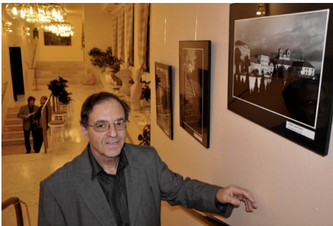
Autor snímků Petr Hermann si k životnímu jubileu nadělil výstavu, která potrvá do konce roku.

Návraty do oblíbených litoměřických zákoutí, ale i návrat k černobílé fotografii. Tak lze