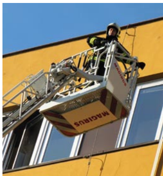
Hasiči evakovali pacienty i prostřednictvím výškové techniky.

Účelem bylo kromě prověření taktických postupů hasičů při likvidaci požáru také jejich seznámení s problematikou zásahu v členitém prostoru areálu nemocnice. Ze strany nemocnice šlo o to, aby se procvičila evakuace pacientů a prověřila připravenost per-