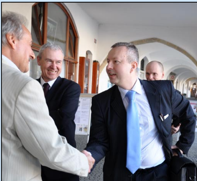
Ministra životního prostředí Brabce, který je zároveň poslancem Parlamentu ČR za Ústecký kraj, starosta informoval o projektech realizovaných v oblasti životního prostředí.