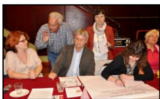
Loni se diskutovalo v DK nejen o tématech kultury a sportu ve městě.