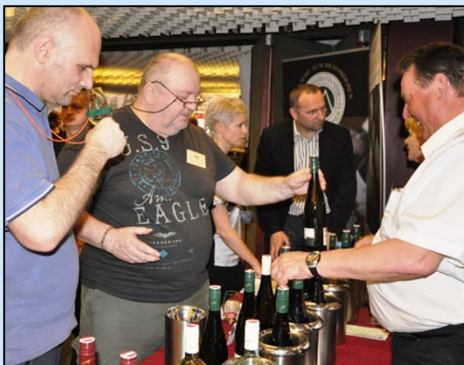
Stovky návštěvníků míří do Litoměřic ochutnat produkty nejen českých, ale i zahraničních vinařů.