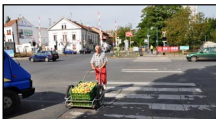
Přechod pro chodce u Pokratických závor v Teplické ulici by v budoucnu měl projít úpravou.

V nejbližší době bude mít město k dispozici dopravní studii, podle které by zde měly vzniknout středové ostrůvky, vysazené chodníkové plochy a zálivy po obou krajích vozovky, které umožní zkrátit přechodovou vzdálenost přes jízdní pruhy na v současnosti normami a předpisy požadovaných max. šest a půl, respektive sedm metrů. „Přechodové ostrůvky s osvětlením by nejen významně zvýšily bezpečí chodců, ale i přehlednily dopravu,“ upozorňuje na výhody