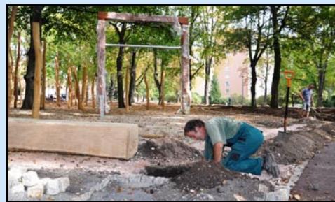
Práce na dokončení parku v těchto dnech finišují.

Po rekonstruovaných a předlážděných chodnících je možné už nyní kráčet v ulicích Svojsíkova, Žižkova a Osvobození. V centrální části Jiráskových sadů probíhají práce na středovém pásu – pomyslném srdci parku. Přáním obyvatel bylo zachovat v této části vodní prvek. „Kompletní rekonstrukce fontány v její původní podobě se však ukázala být problémem z finančního hlediska i z pohledu následné údržby. Fontána je proto nahrazena vodními prvky, jako jsou stříky, vodní hranol, pítko. Ty budou lépe využitelné pro všechny návštěvníky parku,“ vysvětlila Jitka Přerovská, ředitelka Nadace