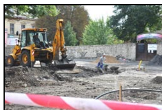
Po úpravách zde bude 48 parkovacích míst.

„Modernizace zahrnuje odvodnění prostoru, položení kamenné dlažby v kombinaci s asfaltem, nové veřejné osvětlení a