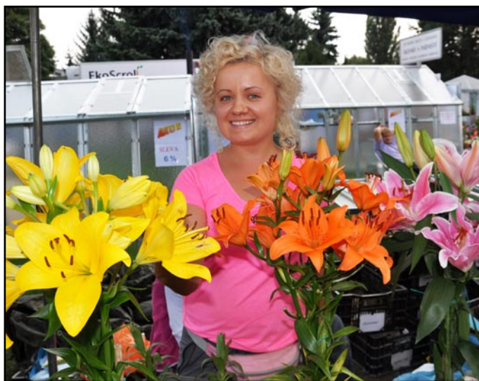
Okrasné zahrady, ale květiny v jednotlivých stáncích patřily mezi ozdoby letošní Zahrady Čech.