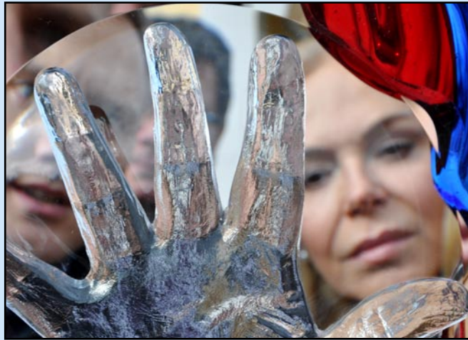
Odlitek dlaně svého zesnulého manžela Václava si prohlédla i bývalá první dáma Dagmar Havlová.