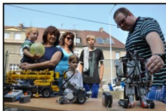
Pro děti a mládež se zájmem o techniku je zde Technický klub.

Včelařský kroužek patří mezi ty tradiční, stejně jako keramický, modelářský, herpetologický, jezdecký, rukoprčkový, jazykový nebo řada sportovních (trampolíny, zumba kids, breakdance, aerobik, mažoretky apod.). V letošním školním roce však přibyla i řada nových. Patří mezi ně klub kreativity určený dětem od 10 let, zaměřený na rozvíjení manuální zručnosti a estetického citění. Pro mládež od 15 let je zase vhodné adrenalinové umění, kterému se naučí ve Fire show (propojení tance a točení ohněm). Příznivce si jistě najde i kroužek šperkování, v němž se děti od osmi let naučí vyrábět šperky různými technikami. Kroužek roztleskávaček