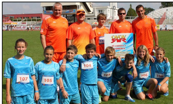
Úspěšní sportovci z Ladovky na fotografii s patrony akce Robertem Změlíkem a Romanem Šebrlem.