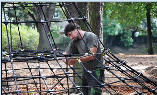
V plném proudu je na několika místech montáž hracích prvků určených dětem.

První říjnový víkend bude patřit architektuře. V rámci celorepublikového festivalu se lidé mohou už čtvrtým rokem vypravit za objevováním zajímavých staveb a potenciálu veřejného prostoru v řadě měst