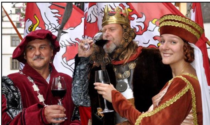
Král Karel IV. si číši vína s purkmistrem a se svou královnou opravdu vychutnal.

Letošní počasí litoměřickému vinobraní nepřálo, ale náladu si tisíce lidí, ani prodejci burčáku zkazit nenechali. Do Litoměřic přijelo sedm desítek prodejců.