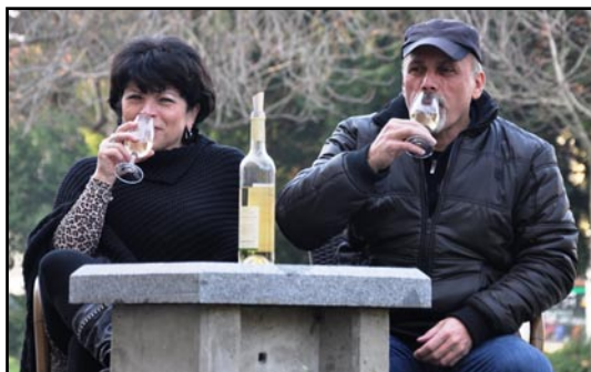
Svatomartinská vína ochutnávali loni v listopadu lidé nejen v degustační místnosti, ale i před Hradní vinárnou, kde hráli Veselí lidí.

V době od 13 do 19 hodin bude připravena nejen ochutnávka mladých a Svatomartinských vín, ale i různé pochoutky, včetně sýrových. Příjemnou atmosféru, provoněnou Svatomartinskými víny pocházejícími z české produkce, zpestří od 14 do 17 hodin živá hudba. „Vstup bude volný, degustační vzorky vín a pochoutky si návštěvníci budou moci zakoupit dle vlastního