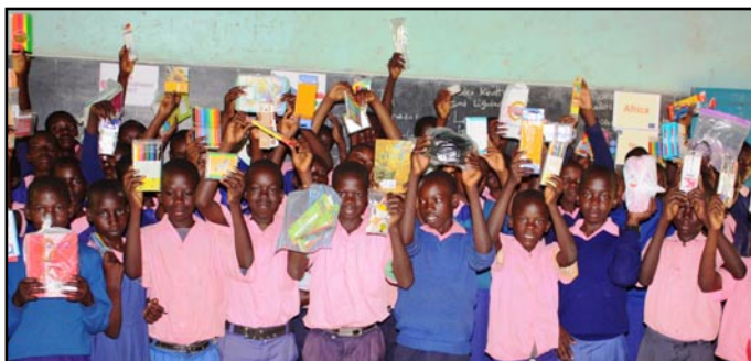
Keňské děti děkují za zaslání školních pomůcek Základní škole U Stadionu.

„S pomocí podpory Masarykovy školy mohla škola Kawili dovybavit knihovnu potřebným nábytkem. Loni se do projektu zapojily základní školy U Stadionu a Na Valech. Například ZŠ