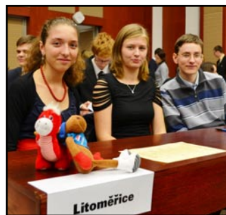
Litoměřičtí gymnazisté v Chebu ukázali, že umí.