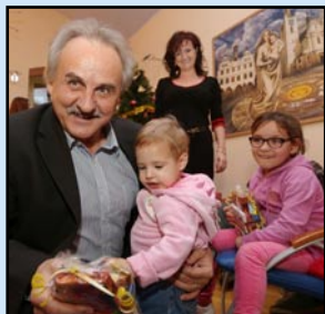
Malé děti neskřivaly radost z balíčku sladkostí, ty velké naopak potěšil nový počítač.