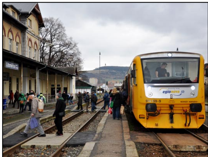
Finančně nákladná modernizace horního vlakového nádraží, které leží na trati Lovosice - Litoměřice - Česká Lípa, přinese cestujícím větší bezpečí a vyšší komfort cestování.

„V tuto chvíli již máme kompletní projektovou dokumentaci a zažádáno o vydání stavebního povolení,“ uvedla vedoucí odboru územního rozvoje městského úřadu Venuše Brunclíková. SŽDC je ve fázi zpracování posouzení vlivu stavby na