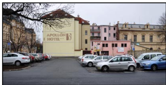
Modernizované parkoviště Na Valech pojme 45 vozidel.