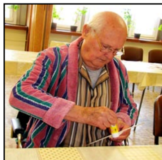
V ergoterapeutických dílnách si klienti s pomocí ergoterapeutů procvičují i jemnou motoriku.