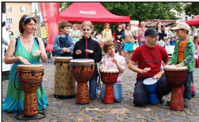
Jednou z nejvýznamnějších fairtradových akcí, která se v Litoměřicích v loňském roce uskutečnila, byl letní festival Dun dun podporující Afriku.