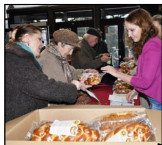
Při vstupu do domu kultury dostal každý pozvaný senior vánočku.