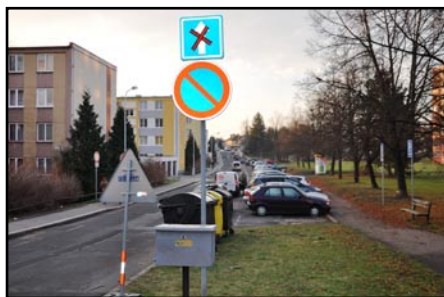
Parkovat v Družstevní ulici je díky obousměrnému provozu možno již jen po jedné straně.

„Přistoupili jsme k němu dle původního plánu dopravního opatření od autora projektu přestavby křižovatky, po vydání souhlasného stanoviska dopravního inspektorátu Policie ČR a konzultaci s majetkovým správcem místních komunikací. Obávali jsme se totiž, že zde v souvislosti s rekonstrukcí křižovatky na Vojtěšském náměstí vznikne pomyslné dopravní hrdlo, které způsobí rozsáhlé kongesce v dopravě. Rovněž bylo potřeba zajistit obzvláště vozi-