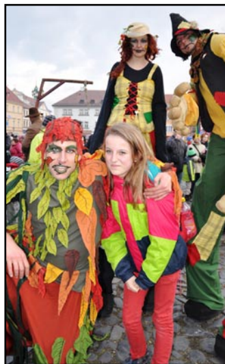
O veselé masky nebude v průvodu nouze.