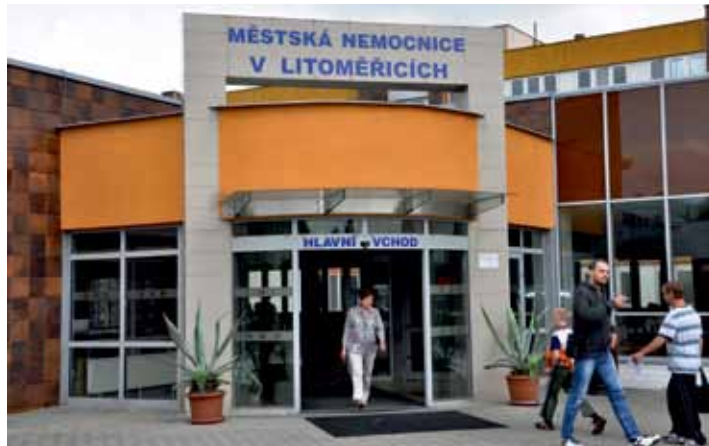
Nejstarším pavilonem Městské nemocnice v Litoměřicích je interna, která byla uvedena do provozu v roce 1985. Postupně byly dostavovány další části komplexu. Na snímku vidíme vstupní část.

Vedení nemocnice zavedlo v minulosti řadu úsporných ekonomických opatření a neustále pracuje na zvyšování efektivnosti poskytovaných zdravotních služeb. Potýká se však, stejně jako celé zdravotnictví v ČR, s personální krizí. Ačkoliv v loňském roce i letos došlo ke znatelnému navýšení platů lékařů i sester, nedaří se příspěvkové organizaci, vázané tarifními platy, personální situaci v klíčových zdravotnických pozicích stabilizovat. Navzdory všem opatřením hrozí nemocnici v následujících letech minusové hospodaření. Jde o to, že současné příjmy od zdravotních pojišťoven, regulované současnou vládní politikou, nekryjí zvýšené výdaje nejen na zdravotní