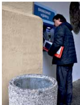
Koše již jsou umístěny také u většiny bankomatů.

„V současné době je po městě rozmístěno zhruba pět stovek odpadkových koší, jejichž počet rok od roku mírně stoupá. Pravidelně vyměňujeme koše rozbité. S doplněním nových nyní čekáme na výsledky ankety,“