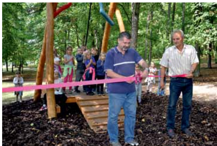
Lanová dráha na úpatí Mostné hory je výsledkem prvního participativního rozpočtování. Zahájení provozu se v září zúčastnily děti ze školní družiny Základní školy Boženy Němcové.