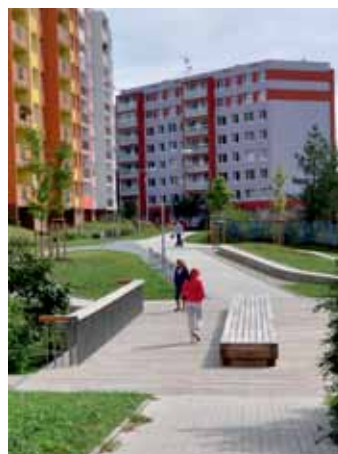
Lávka přes potok byla stavebně nejnáročnější akcí 1. etapy.

Nově má být řešena páteří cesta regenerovanou plochou. Tato pěší spojnice severní části města s přírodní památkou Bílá stráž bude opravena, po obvodu umocněna