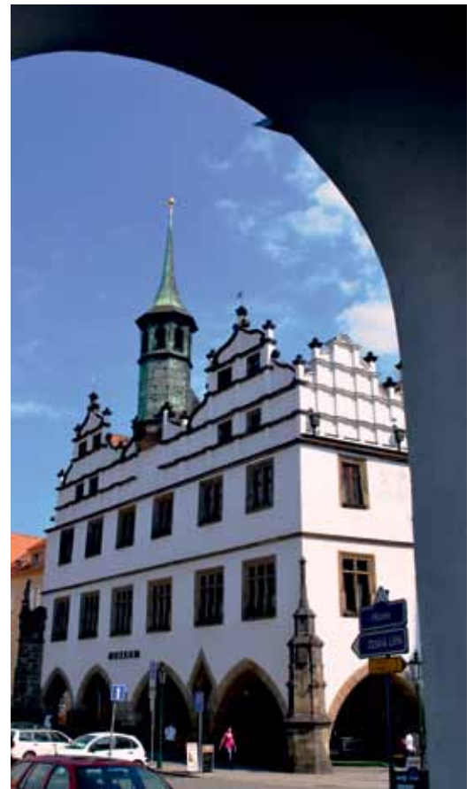
Bývalá radnice, dnes muzeum, je jednou z nejkrásnějších staveb historického jádra města.