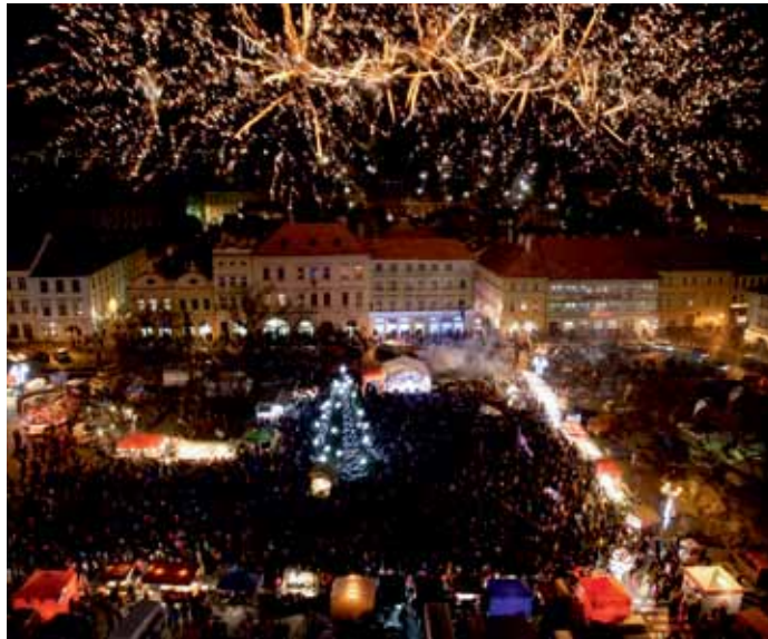
Rozsvícení vánočního stromu každoročně přilázejí tisíce malých i velkých obyvatel města. Ani letos nebude chybět ohňostroj.

Prozatím nenasvíceny zůstane kostel Všech svatých. Loňský rok ukázal, že vánoční ozdoby byly v jeho případě po téměř deseti letech užívání nefunkční. Nákup nových vyjde na zhruba 200 tisíc korun. „Tuto investici jsme po dohodě s vedením města nechali na příští rok,“ vysvětlil ředitel Elman. (eva)