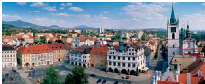
Mirové náměstí každoročně obdivují tisíce turistů.

Určitou naději pro mě bylo poslední jednání zastupitelstva, které naznačilo ze strany ANO možný obrát k lepšímu. Těším se na něj.