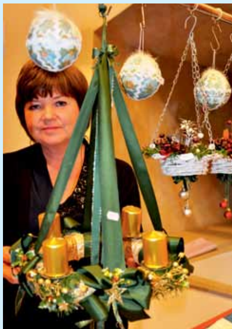
Adventní jarmark v hradu se těší oblibě. Je vždy příležitostí zakoupit si domů nejen adventní věnce, ale i řadu dalších výrobků.

10:00 pěvecký soubor ZUŠ 11:00 živý betlém na nádvoří 13:00 flétnový soubor ZUŠ 14:00 živý betlém na nádvoří 15:00 Mladivadlo ZUŠ 16:00 živý betlém na nádvoří