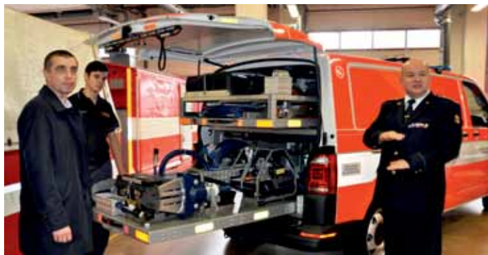
Místostarosta Grund a ředitel litoměřického územního pracoviště HZS Boleslav Lang si prohlížejí nový, moderně vybavený transportér.

„Za tuto částku jsme zakoupili přístroj pro vysoušení protichemických a ochranných obleků a kombinéz, pracovní plošinu sloužící především pro zásah u dopravních nehod nákladních automobilů nebo autobusů, nehodovou clonu a skládací posypový vozík, který upotřebíme tam, kde je třeba aplikovat sorbentní látky při likvidaci úniku nežádoucích nebo