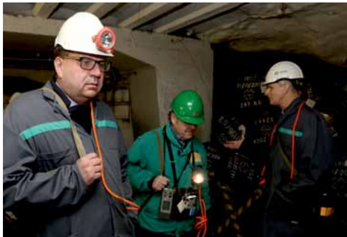
Ministr Mládek při prohlídce úložiště.