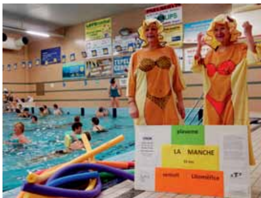
Loňský první ročník akce přinesl nejen příjemné chvíle spojené s plaváním, ale i spoustu zábavy a doprovodného cvičení.

Litoměřický bazén je dlouhý 25 metrů. 1400 přeplavených bazénů představuje přesně 35 kilometrů. Zdá se to hodně? „Ano, na jednoho plavce dost, ale když nás