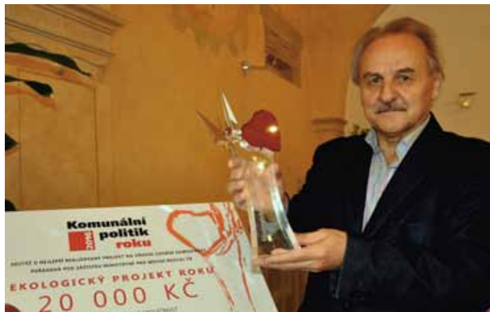
Cena pro starostu kromě prestiže přinesla i dvacetitisícový příspěvek do rozpočtu města.