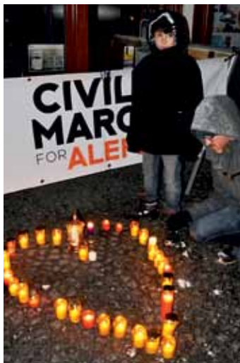
Dospěli i s dětmi vyjadřovali solidaritu s Allepem.