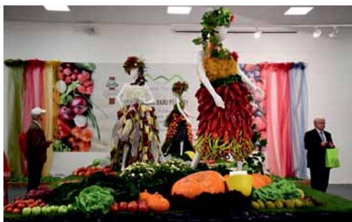
Obdiv sklízela hlavní expoziční plocha pavilonu A, stylizovaná v duchu módní přehlídky. Dominovaly jí ženské postavy oděné do darů přírody.