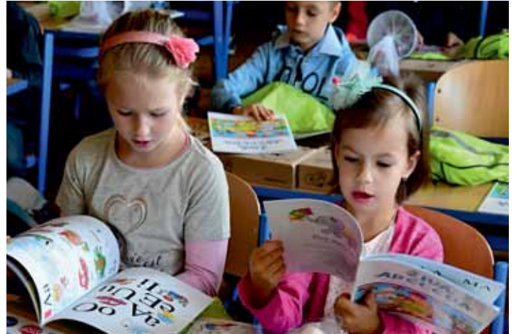
Školní sešity, čítanky, ale i drobné dárečky našli prvňáčci Základní školy v Havlíčkově ulici na svých lavicích.

Například Havlíčkova ZŠ letos otevírá tři třídy pro 57 prvňáčků. „Nechtěla jsem, aby počet ve třídě překročil dvacítku. Klidně a po-