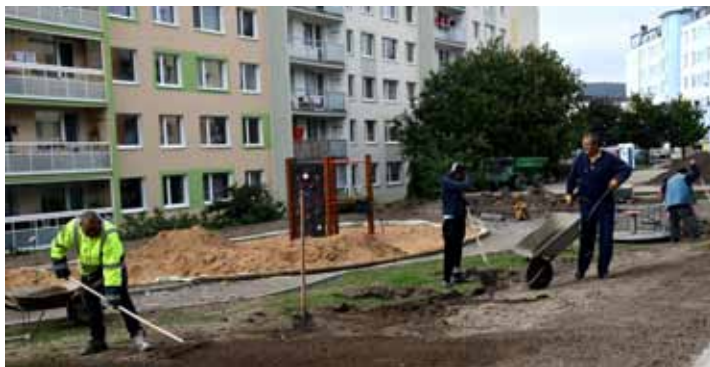
Terénní úpravy nového multifunkčního hřiště mezi panelovými domy běží naplno.

Obyvatelé Pokratice však mají naději, že revitalizace sídliště bude pokračovat čtvrtou etapou. Zastupitelé totiž v září schválili podání žádosti o dotaci na regeneraci další části, dotýkající se ulic A. Muchy, Hynaisova a Ladova.