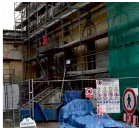
Budova je částečně obehnaná lešením.

„Nejvýraznější podíl prací připadne na vnější část čtyřpatrové budovy. Stavbaři zrekonstruují fasádu a vymění okna a vnější dveře. Kompletní výměny se dočká dvouramenné schodiště, které vede z ulice do výpravní budovy a jednoduché schodiště do tamní restaurace. Rekonstrukce se dotkne také přístřešku nad perónem, kde stavbaři kompletně vymění krytinu. Uvnitř výpravní budovy dojde především ke stavebním úpravám veřejných prostor v přízemí. Zásadní bude přemístění pokladen a vybudování nových prostor pro zázemí zaměstnanců a nových sociálních zařízení,“ stojí v tiskové zprávě společnosti Chládek a Tintěra, která je dodavatelem stavby. (eva)