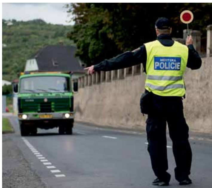
Strážníci stavěli kamiony v Žernosecké ulici, nedaleko hřbitova.

Hlídky městské policie dlouhodobě kontrolují také vozidla projíždějící. „Pokud má hlídka důvodné podezření pro porušení zákazu tranzitu, projíždějící vůz odstaví a kontroluje na místě. Pochopitelně se však může stát, že některý řidič zákaz poruší a naší kontrole unikne. Z důvodu kapacity hlídek není možné vysledovat všechny,“ dodal velitel.