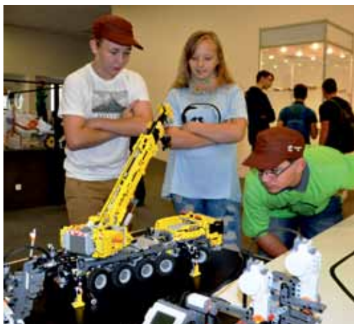
Technický klub mládeže připraví i v letošním roce přehlídku svých aktivit.