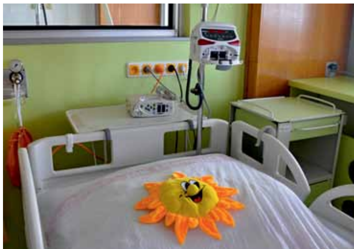
Takto vypadá dětské lůžko JIP. Postele jsou polohovací.

Zároveň byla v centrální chodbě 5. patra dětského oddělení položena nová podlahová krytina, byly nové natřeny dveřní zárubně. U jednoho z pokojů došlo k rozšíření vstupu z důvodu pohodlnější manipulace s lůžkem. „Pro zvýšení komfortu osob doprovázejících naše dětské pacienty byla zřízena čajová kuchyňka přístupná z hlavní chodby oddělení,“ zmínil další důležitý fakt Janošík.