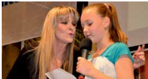
Herečka, moderátorka a zpěvačka Poullain se i letos ujme moderování aukce.

Diakonie ČCE zve veřejnost 10. listopadu od 18 hodin do hradu na 23. společenský večer s benefiční aukcí, tentokrát s názvem „Náš příběh pokračuje“. Akce symbolicky navazuje na úspěšné oslavy 25. výročí založení organizace. Hostem večera je herečka a zpěvačka Chantal Poullain, která vydraží díla výtvarníků i výrobky z Diakonie. Výtěžek aukce bude věnován na provoz sociálních služeb v Diakonii.