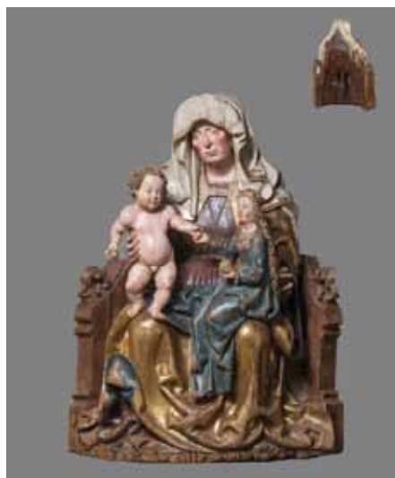
Svatá Anna Samotřeti z Ústí nad Labem.

Pozdně gotický sochař Ulrich Creutz se těší