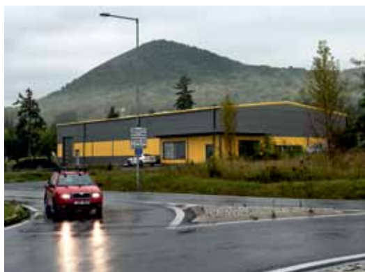
Hala v těsné blízkosti kruhového objezdu byla postavena bez stavebního povolení.

Na počátku června proto vyzval stavební úřad vlastníka stavby k doplnění stanovisek stavbou dotčených orgánů (památkářů, odboru životního prostředí, odboru dopravy, dále vlastníků sítí, doložení měření radonu a posouzení energetické náročnosti budovy apod.) a doplnění projektové dokumentace. Kladná stanoviska již má k dispozici, na projektovou dokumentaci čeká. Po jejím dodání bude