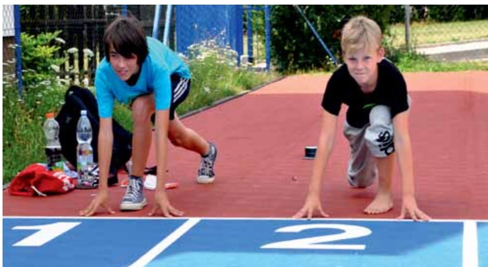
Už o prázdninách děti využívaly nové běžecké dráhy v areálu Ladovy základní školy.

Venkovní multifunkční hřiště všech litoměřických základních škol byla o prázdninách v provozu. Pod dohledem správců využívala mládež v hojně míře sportoviště, z nichž některá prošla částečnou obnovou.