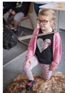
Slavnostní pasování žáků druhých tříd na čtenáře v Knihovně K. H. Máchy.