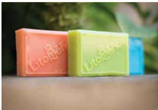
Mýdla s logem města se vyrábějí v sociálně terapeutických dílnách Naděje v Litoměřicích.

Litoměřické infocentrum zařadilo do sortimentu upomínkových předmětů voňavá mýdla s logem města vyrobená v sociálně terapeutických dílnách Naděje.