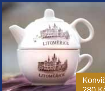
Konvička 280 Kč