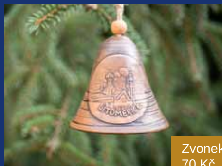
Zvonek 70 Kč