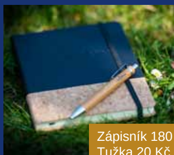
Zápisník 180 Kč Tužka 20 Kč