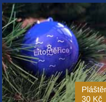
Pláštěnka 30 Kč