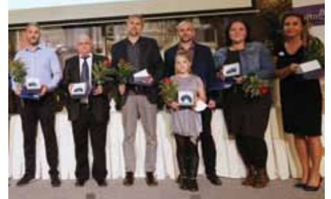
Šest srdcařů, jimž patří naše DĚKUJEME.