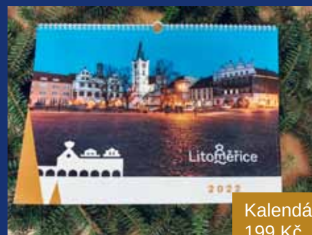
Kalendář 199 Kč