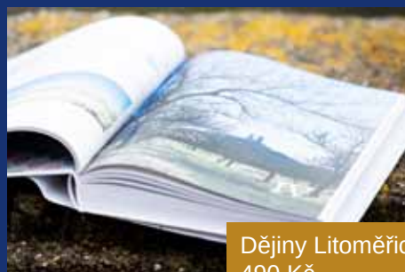
Dějiny Litoměřic 490 Kč