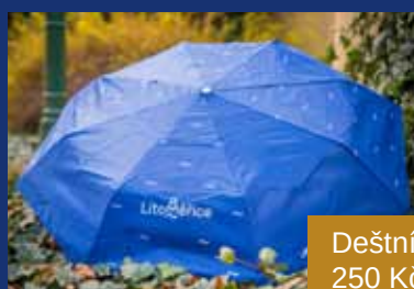
Deštník 250 Kč