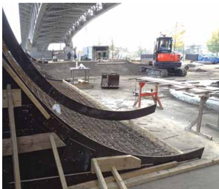
Oprava skateparku skončí na jaře.