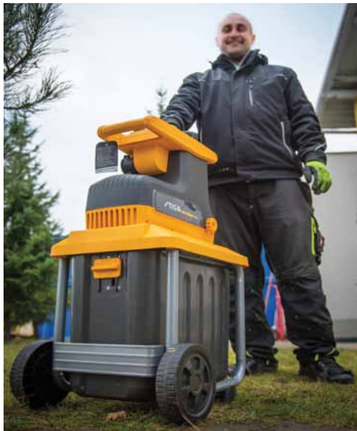
Drtič větví si můžete zdarma zapůjčit ve sběrném dvoře v Nerudově ulici. Město jich má k dispozici celkem sedm.

Podmínkou pro zapůjčení drtiče je trvalý pobyt v Litoměřicích (předložení občanského průka-