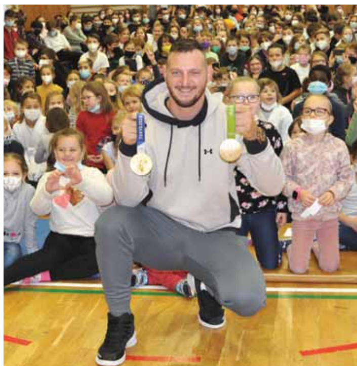
V roce, kdy si litoměřické judo připomíná 60 let své existence, zavítal do města držitel dvou zlatých olympijských medailí Lukáš Krpálek. Přivítala ho skandující hala plná žáků ZŠ Ladova.

Díky nové službě rychle zjistíte, zda či odkdy budete mít nárok na starobní důchod a jak vysoký by mohl být. /více na str. 9/