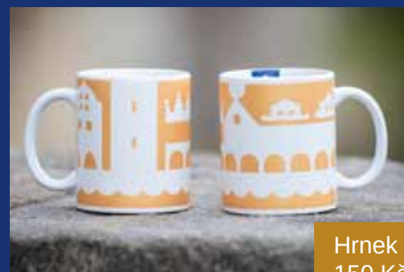
Hrnek 150 Kč