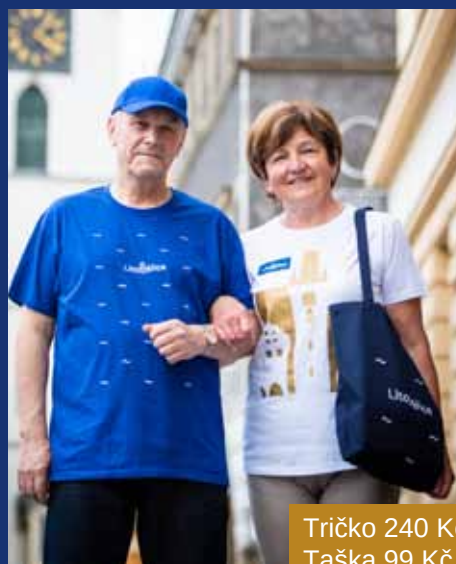
Tričko 240 Kč Taška 99 Kč