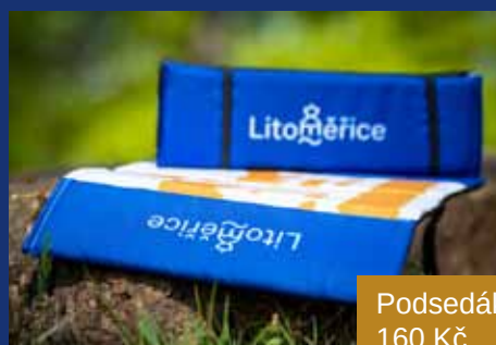
Podsedák 160 Kč