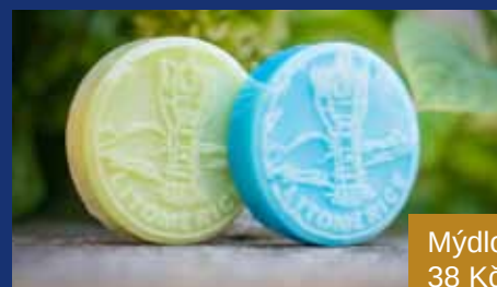
Mýdlo 38 Kč