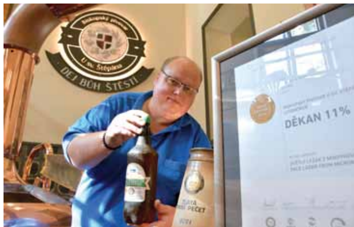
Biskupská jedenáctka Děkan znovu triumfovala na mezinárodní soutěži v Českých Budějovicích.

Letošního ročníku se účastnilo 271 pivovarů z 24 zemí.