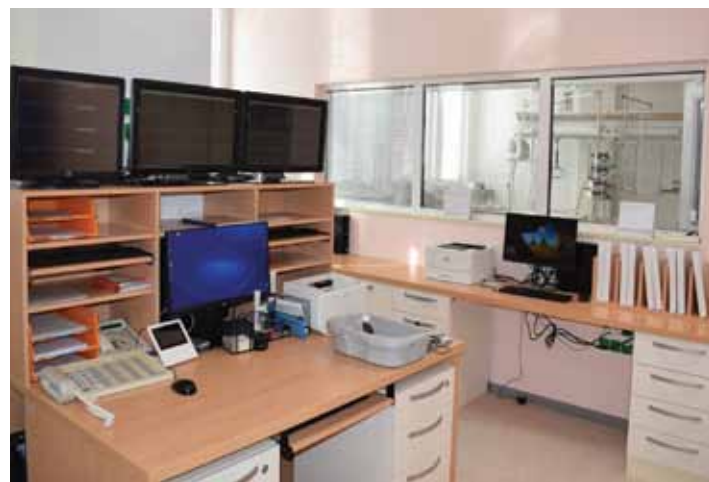
Nejen pokoje pacientů kardiovaskulární JIP, ale i zázemí zdravotnického personálu je výrazně komfortnější.