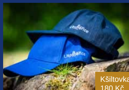
Kšiltovka 180 Kč