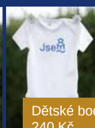
Dětské body 240 Kč