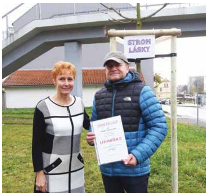
Součástí oprav bylo i vybudování nových autobusových zastávek v obou směrech.

Výsadbou stromů je soukromým projektem ženy pocházející z Prahy. Nápad vznikl z hluboké lásky k jejímu zesnulému muži, který i při těžké nemoci do poslední chvíle rozdával lidem naději, lásku a dobro. „Ráda bych jeho poselství šířila dál touto cestou. Stromy lásky jsou už v jedenácti městech, například v Praze, Plzni, Kutné Hoře či Karlových Varech a budou se vysazovat i v Brně, Vyškově či Kyjově. Všechna oslovená města se do projektu zapojila s nadšením a vždy jsem se setkala jen s pozitivními ohlasy. Děkuji proto představitel-